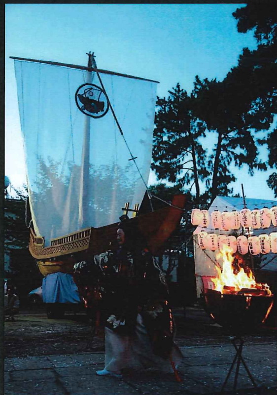
イメージ写真

プロデュース：近畿大学文芸学部文化デザイン学科 岡本清文教授 薪能制作協力 JACSO